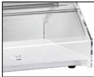
VL 4749B Bianco

PORTA BRIOCHES - CROISSANTS. Piano in legno. Cupola in plx con antine apribili su 2 lati.