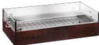
A 1290W Wengé