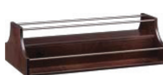
A 1270W Wengé