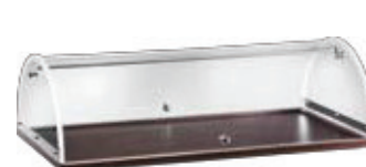
A 1299W Wengé