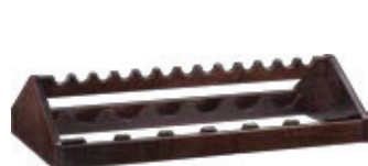
A 1250W Wengé

Provvisto di 8 contenitori eutettici / Equipped with 8 eutetic each / Équipé avec 8 cartouches eutectiques / Mit 8 Kühlplatten ausgestattet